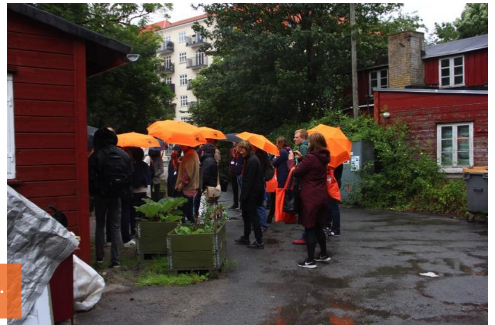
Ballonparken består af en række små charmerende rødmaledede træhuse.