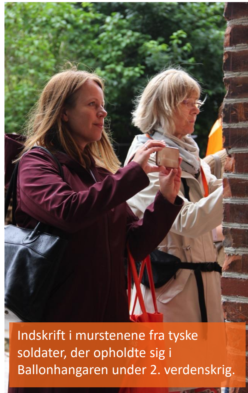
Indskrift i murstenene fra tyske soldater, der opholdte sig i Ballonhangaren under 2. verdenskrig.